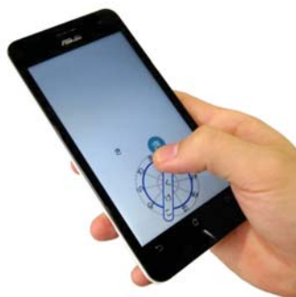
図1: プロトタイプの使用例