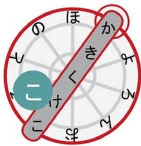
図4: キー配置(お段入力時)