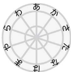
図2: キー配置(待機時)

●円の中心からタッチ点を結んだ線の角度によって子音を選び、線の長さで母音を選ぶ。決定は指を離れた時に行う。